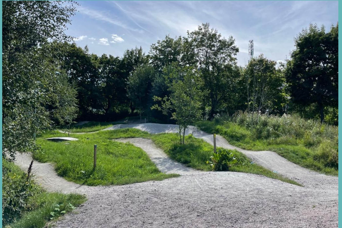
Pumptrack på grus i naturlig miljö