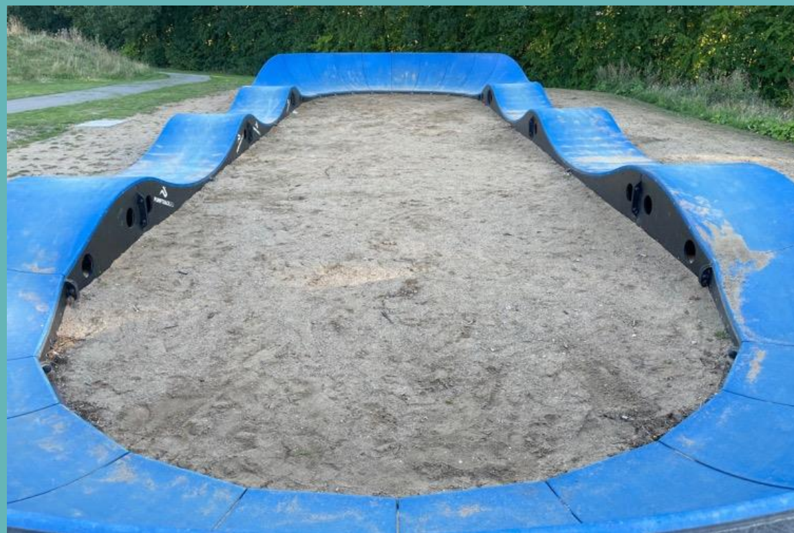
Pumptrack i plast