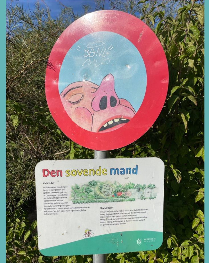
Skyltar med instruktioner