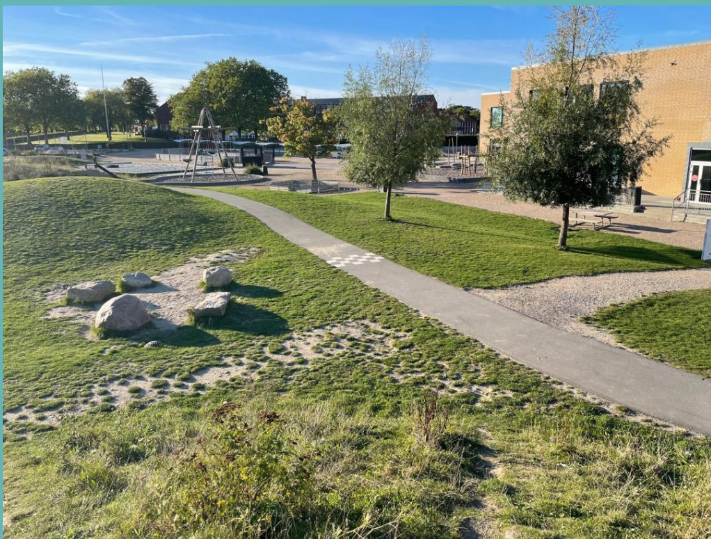
Enkla medel – smal asfaltsgång