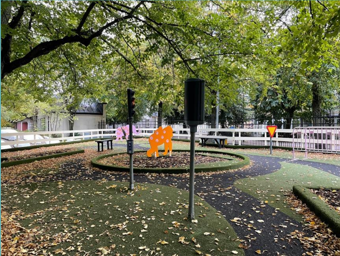
Träna på trafikregler