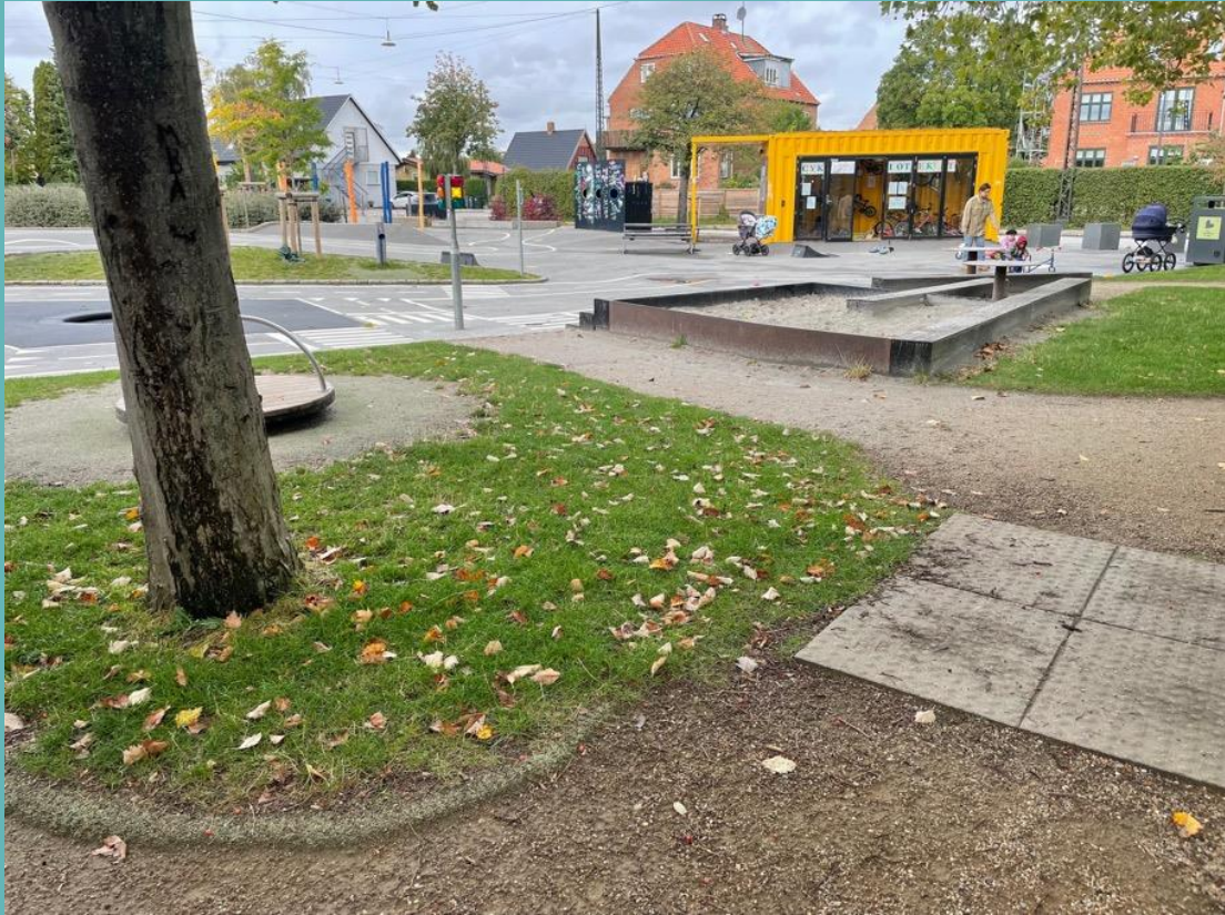
Olika typer av underlag - grus och asfalt