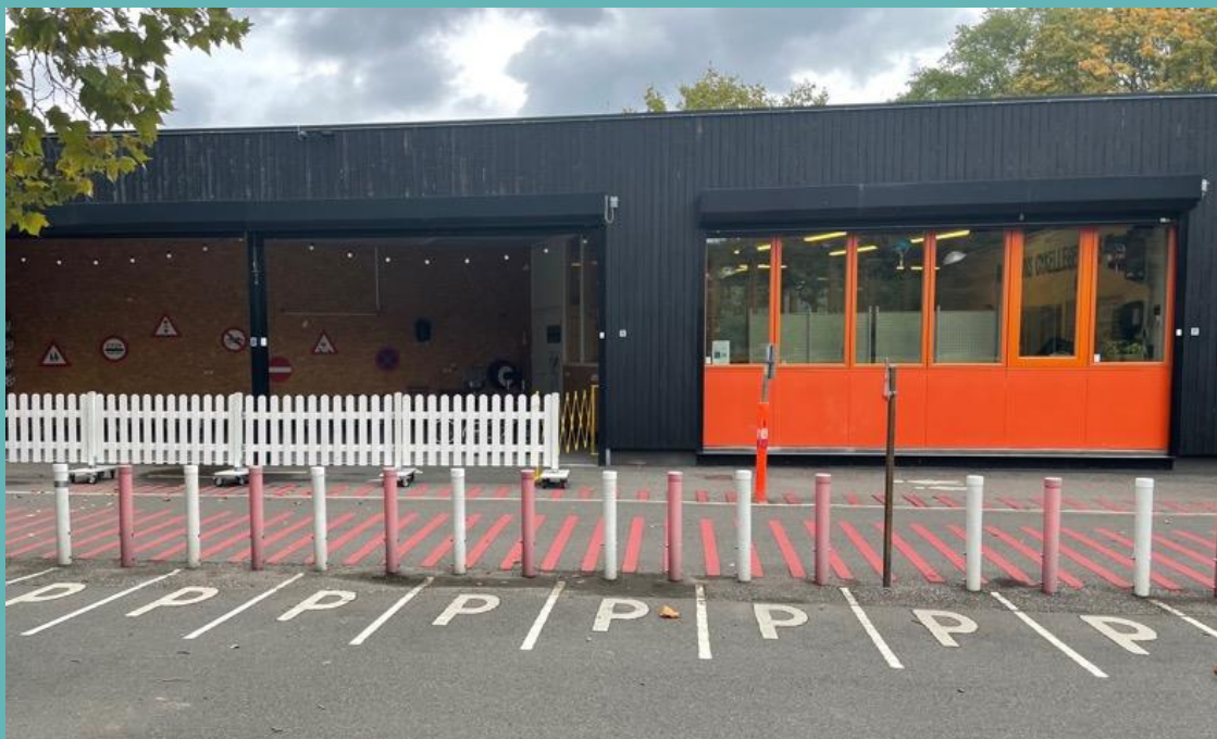
Bemannad med instruktörer