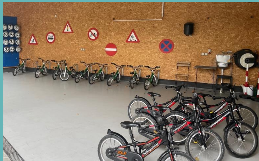
Utlåning av cyklar