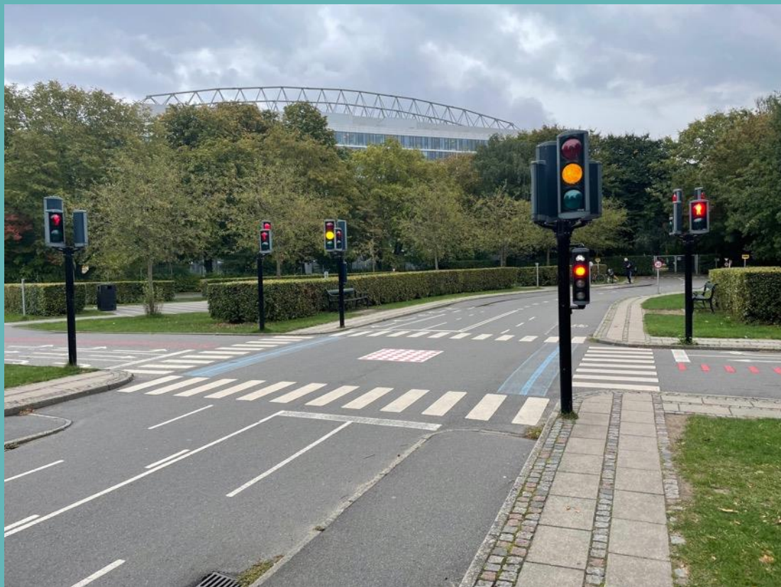
Träna på trafikregler - trafikmiljö i miniatyr