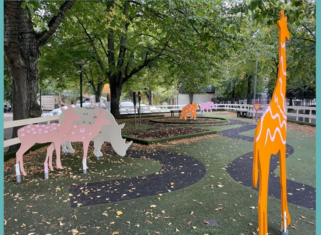
Lekfull miljö för mindre barn