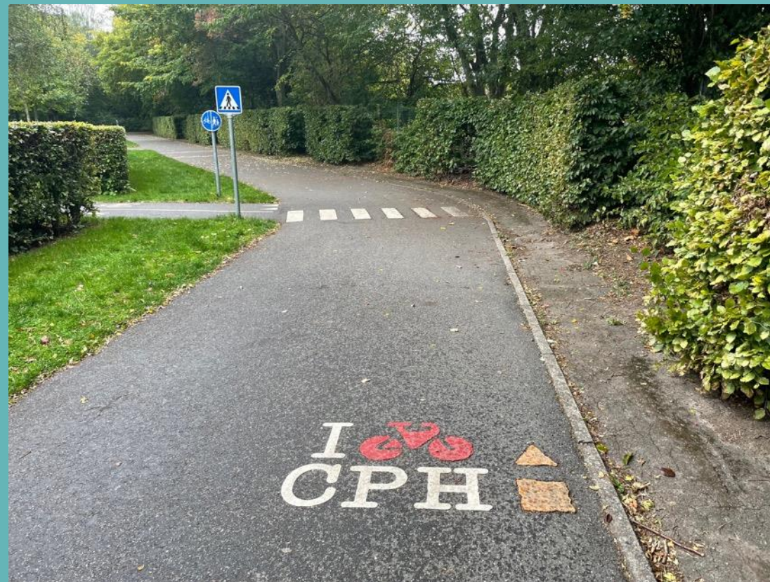
Plant asfalterat underlag - saknar fysisk utmaning