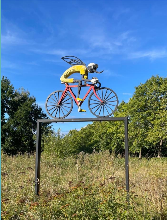
Tema: Cykelmyggen Egon