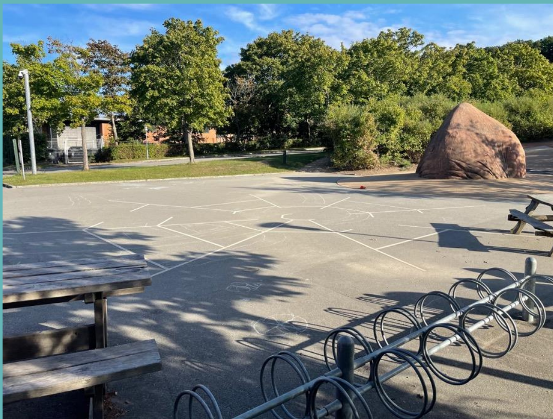
Spindelnät målat på asfalten - med instruktioner