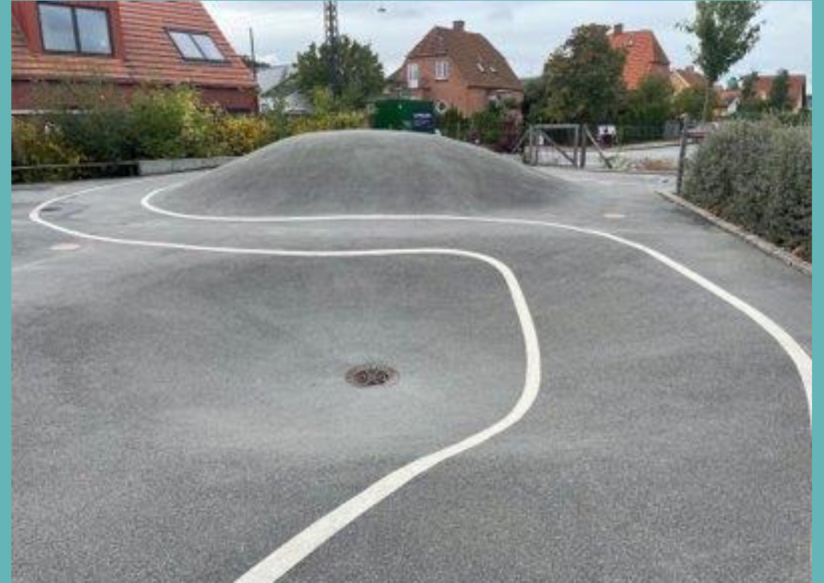
Lekfulla element - gropar och kullar